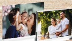
Metacrilatos con peana