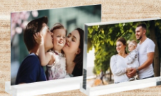
Metacrilatos con peana

CORTE Y GRABADO LÁSER EN MADERA METACRILATO MERCHANDISING SUBLIMACIÓN