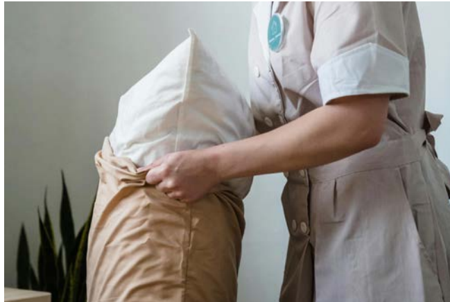
Trabajadora 'haciendo' la habitación antes de los nuevos huéspedes.

lo que, a su vez, ejerce presión sobre el sistema sanitario. El trabajo que realizan, indispensable para el funcionamiento de los hoteles, provoca dolores que con frecuencia terminan en lesiones (tendino-