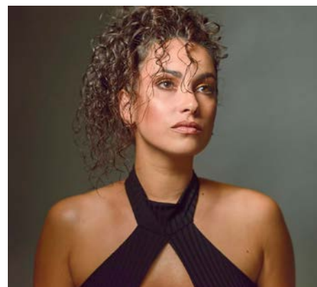
Maquillajes de Thania Russberg.